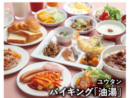
ユクタンバイキング「油湯」